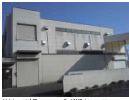
堂々たる新社屋。ここに工場が併設されている