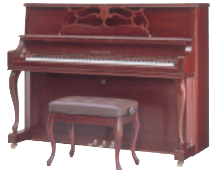
洗練されたデザインが印象的な アップライトU-116WS

ウエンドル&ラングの日本総代理店として、特徴ある事業を展開している株式会社アサヒピアノ。10周年を前に昨年移転した本社新社屋には自社工場も併設し、全国に50店舗の販売店を展開している。また、東京・立川にはショールームもオープンした。