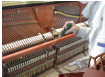
1台1台丁寧に仕上げている