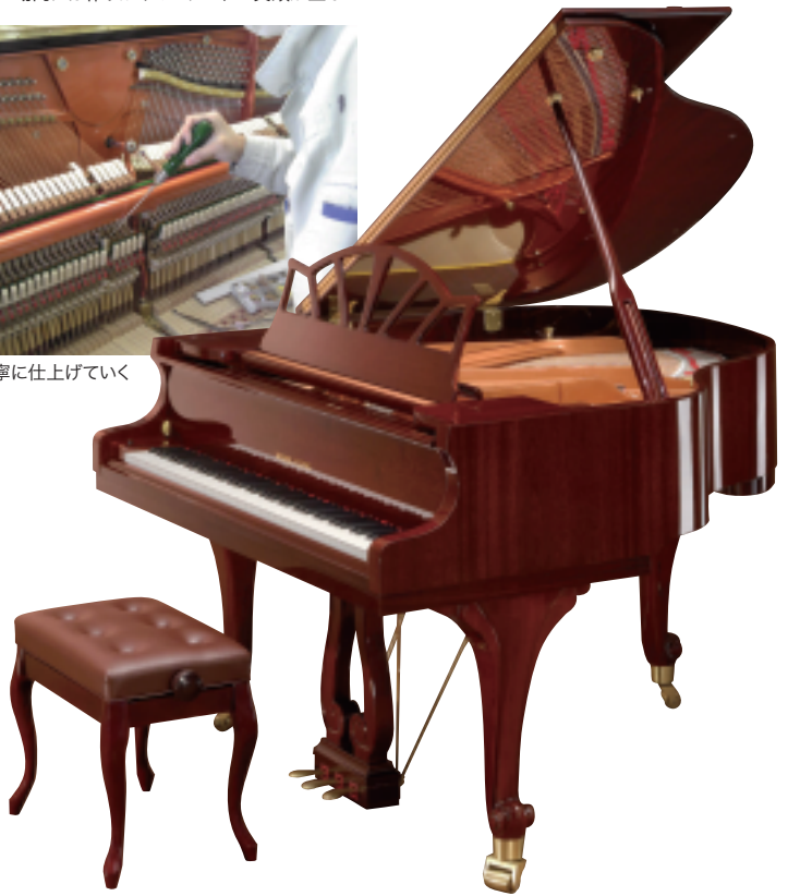
コンパクトグランドの プロモデルG-151M